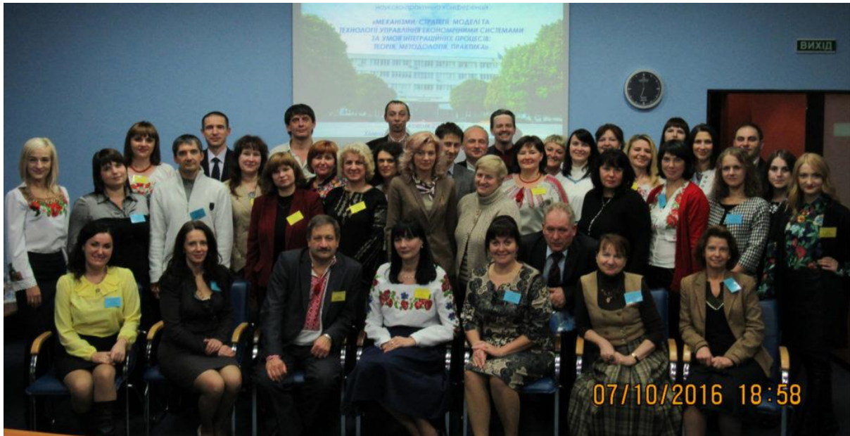
Фото учасників конференції на пам'ять

Науковий доробок учасників конференції опубліковано у науковому виданні «Матеріали III Міжнародної науково-практичної конференції «Механізми, стратегії, моделі та технології управління економічними системами за умов інтеграційних процесів: теорія, методологія, практика» та фаховому журналі «Вісник Хмельницького національного університету. Серія Економічні науки».