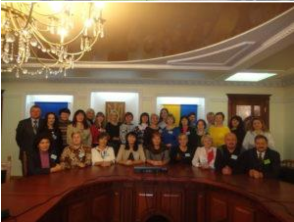
Фото учасників конференції на пам'ять